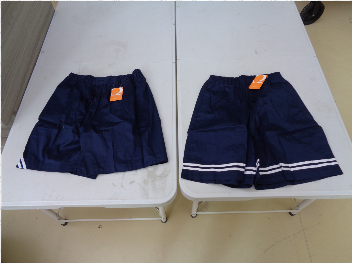
藏青色短裤；藏青色裙裤